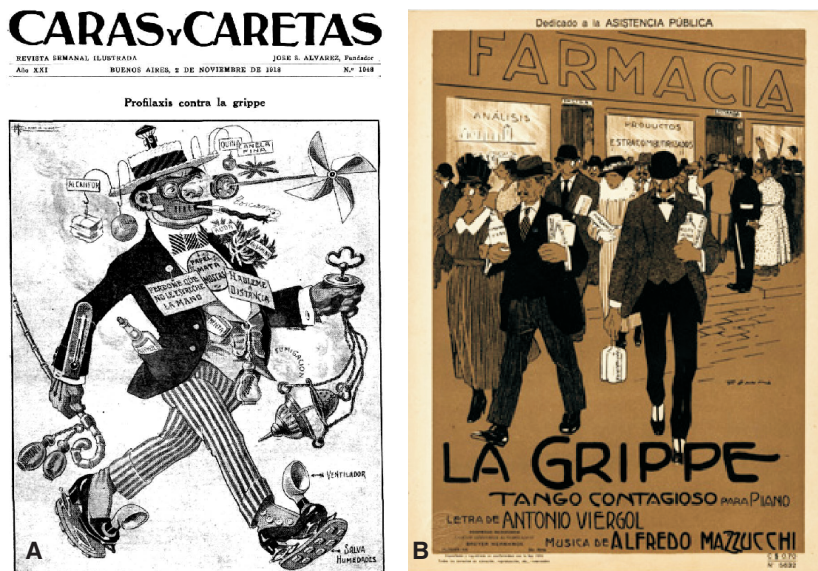
Fig. 1.— A. Profilaxis contra la “gripe”. Precauciones que deberían tomarse para evitar el contagio de la epidemia y que son de resultado infalible. Portada de Caras y Caretas, Buenos Aires, 2 de noviembre de 1918. B. “LA GRIPPE”. Tango contagioso para piano. Dedicado a la Asistencia Pública