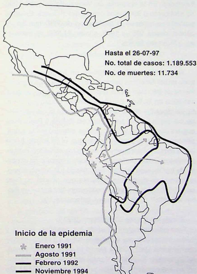
Fig. 1.- Cólera en las Américas. Diseminación de la enfermedad, 1991-1995.

Esta enfermedad cuyo reservorio son las ratas, es transmitida al hombre por las pulgas. Habitualmente ocurren en la Región casos esporádicos, sobre todo en Brasil y en los EE.UU. Sin embargo, ocurrió una epidemia en Perú que desde 1992 a 1995 produjo 1950 casos con 90 defunciones 79 . A su vez en Brasil se detectaron 4 casos en 1994 y en EE.UU. 18 casos y 2 defunciones en 1994-1995. La Tabla 4 describe algunos de los factores que influenciaron la aparición de la epidemia en Perú.