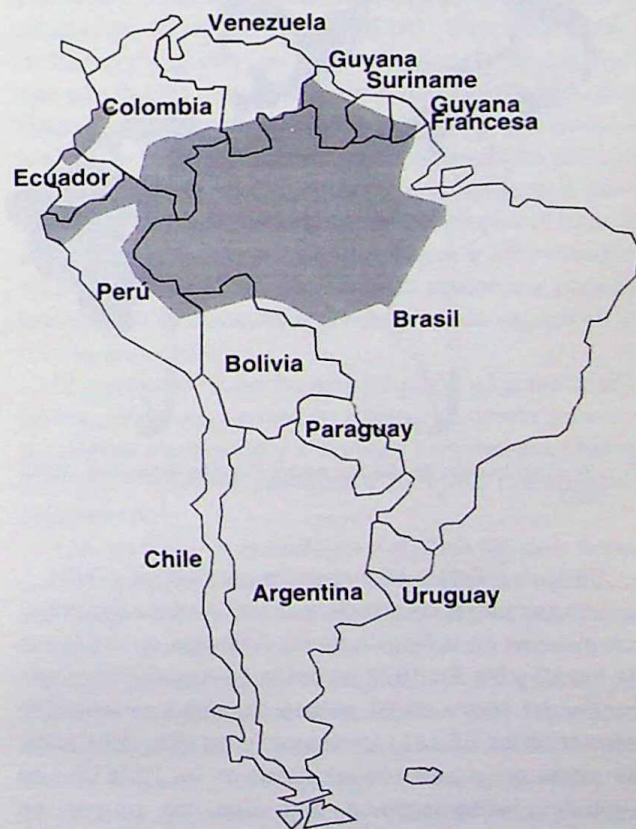
Fig. 2.- Area malarica por Plasmodium falciparum resistente a las drogas.

* Origen de la epidemia: — Agosto 1991, — Febrero 1992; — Noviembre 1994.