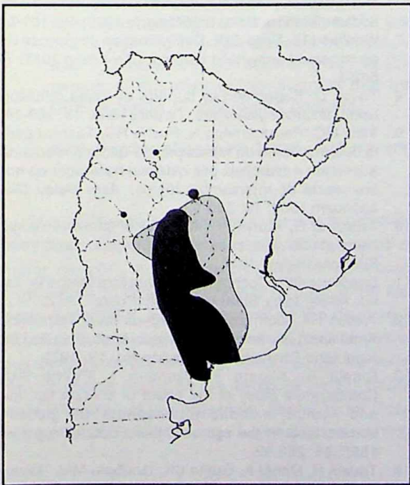
Fig. 2.— Contenido de flúor en aguas de segunda napa en la R. Argentina. En negro: > 3 mg/L, gris: 1-3 mg/L; blanco: < 1 mg/L. (redibujado de Trelles 12 ).

Trabajos previos han demostrado que fluoretrias superiores a 5 \mu M producen inhibición de la secreción de insulina. Este fenómeno ha sido demostrado con fluoruro de sodio tanto in vivo (voluntarios y ratas 5,6 ) como in vitro (perfusión de islotes de Langerhans de rata 5 ). La inhibición de la secreción de insulina no es permanente, es función de la concentración de fluoruro. Estas conclusiones explican la maniobra analítica descrita más arriba y justifican por qué no obstante lo elevado de sus fluorurias, 17 de los 26 pacientes, tuvieron fluoretrias y respuestas insulínicas normales. Los resultados obtenidos en este trabajo confirman que la respuesta insulínica a la sobrecarga de glucosa tiene una relación inversa con la fluoremia (Figura 1). Experiencias de administración oral de fluoruro a la rata 5 sugieren fuertemente que el máximo de inhibición se obtiene con fluoretrias entre 10 y 20 \mu M, lo