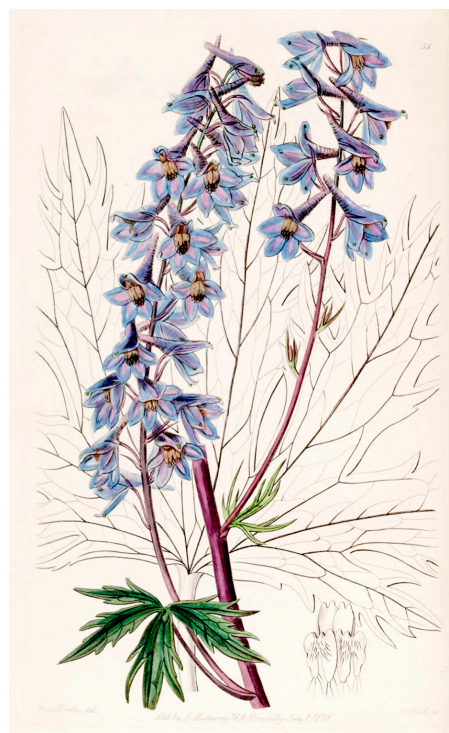
Fig. 1.— Delphinium elatum , var. Palmatifidum

En la investigación sobre animales hay también un sesgo taxonómico, el número de investigaciones publicadas muestra que se adjudican más a unos animales que otros. Mucha investigación sobre pájaros y mamíferos y poca sobre arañas e insectos 3 . Y en la elección de los animales a estudiar interviene el carisma asociado a características como rareza, peligro de extinción, belleza, lindura, impresionabilidad, peligrosidad 4 . No sabemos